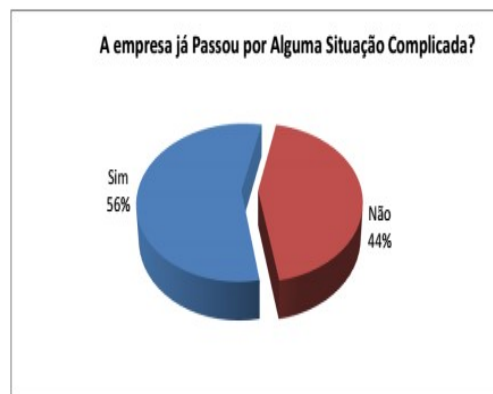
GRÁFICO 3 - Dificuldade com a gestão financeira