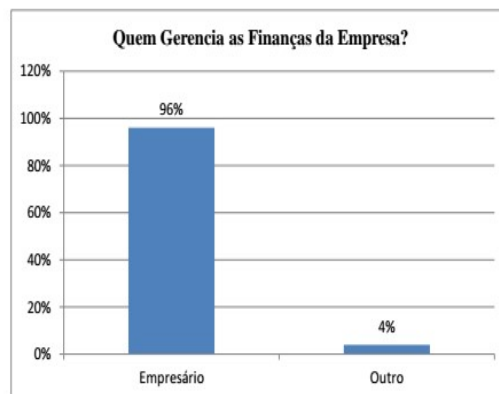
GRÁFICO 2 - Tipo de gestão financeira

contábil também impacta diretamente na sobrevivência dessas empresas.